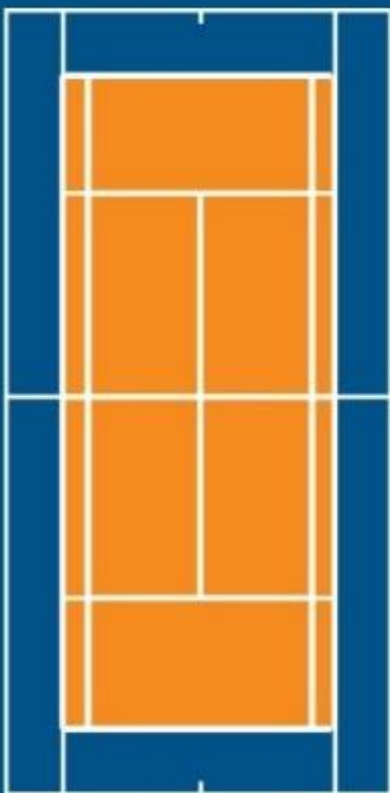
ORANGE – 60' COURT